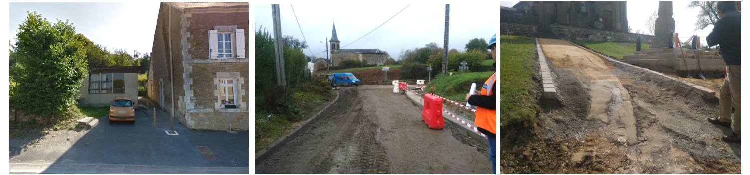
Etat des lieux => Bâtiment désamianté et démoli