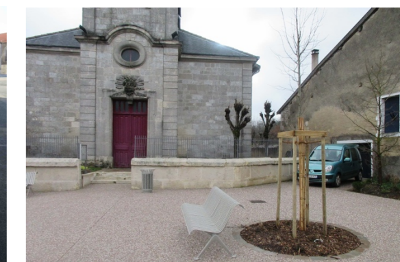
Travaux de revêtement de surface : enrobé, béton désactivé, puis mobilier et plantations