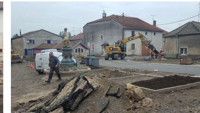
Travaux de terrassements, remplacement de canalisations d'eaux pluviales, pose de bordures et pavés