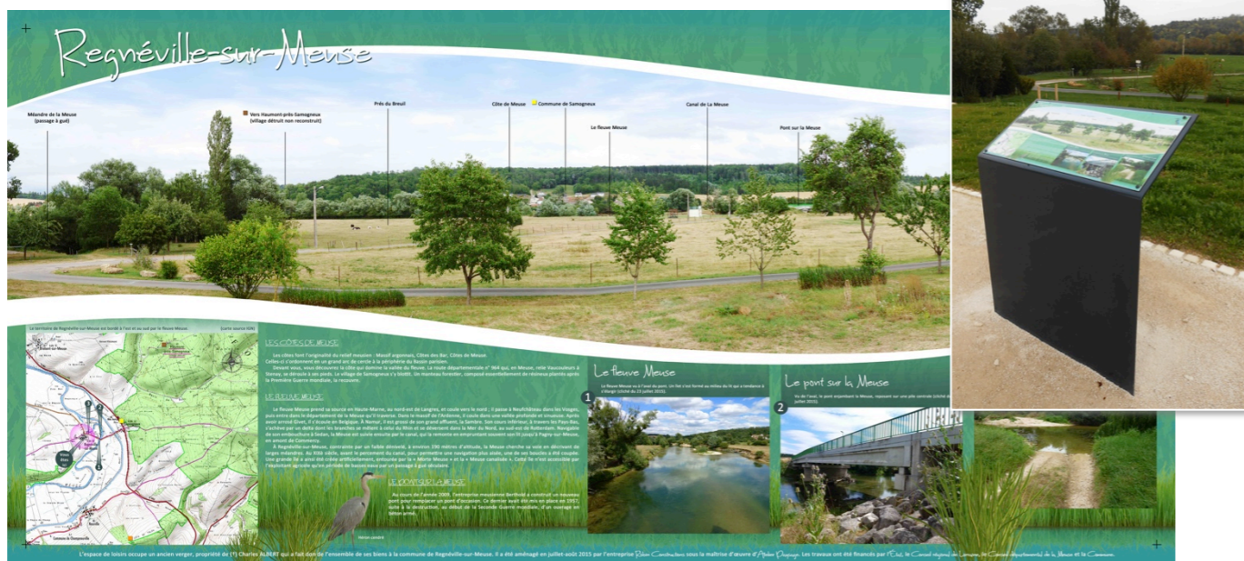
Planche de lecture et compréhension du paysage