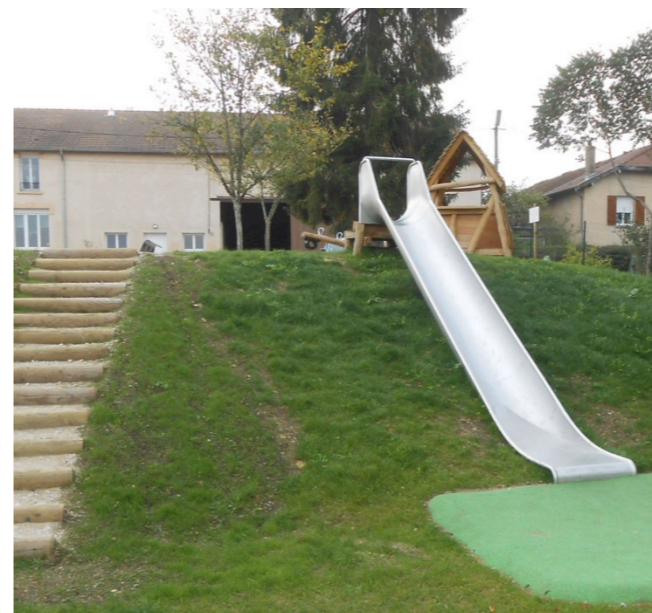
Toboggan sur talus