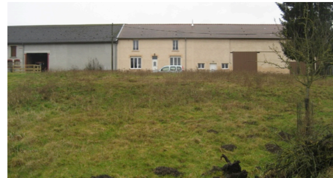
Etat initial : vaste espace enherbé en pente