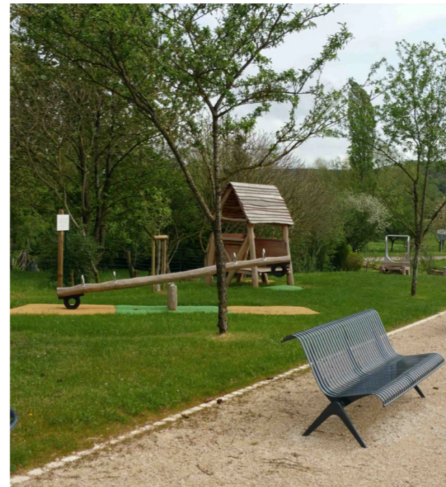
Aire de jeux en bois