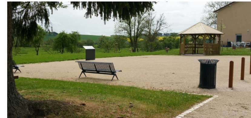
Kiosque en bois donnant sur la place en concassé