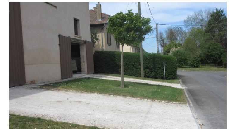
Usosirs : accès en concassé délimité par une ligne pavée