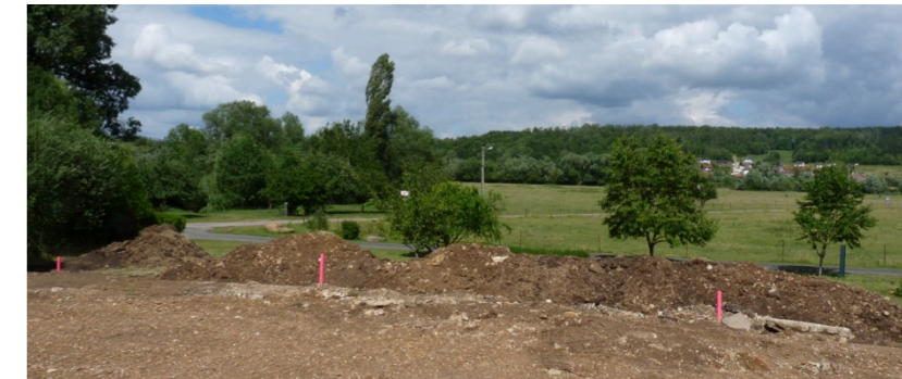
Phase travaux : terrassement des plateformes de la place