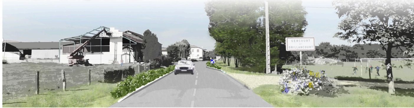
Photocroquis 3 -> Entrée d'agglomération / Chicane