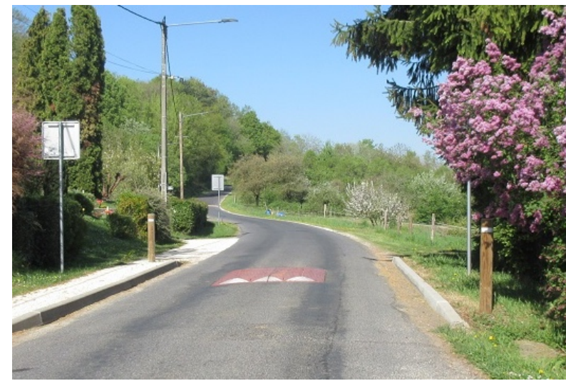
Entrées de Gironville