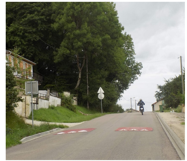
Traversée de Corniéville