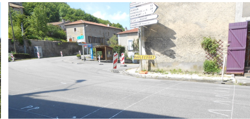
Travaux préparatoires : marquage et essais