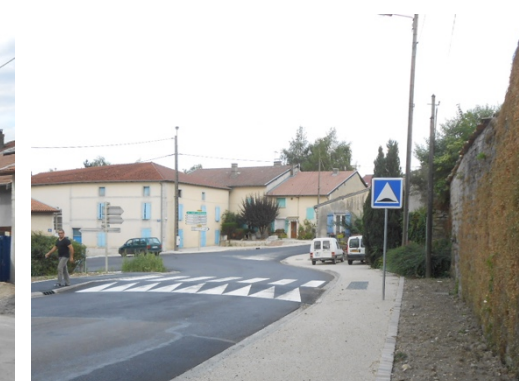
Travaux de revêtements de surface : pavés, concassé, béton et enrobé