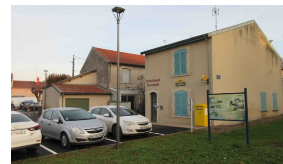
Travaux de revêtements de surface : pavés, béton désactivé et enrobé