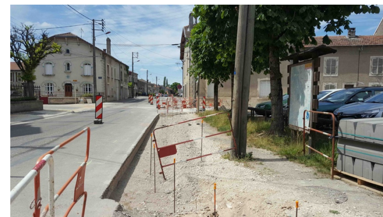
Travaux préparatoires : sécurisation et terrassements