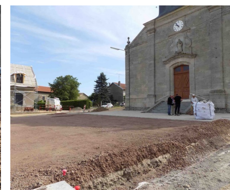
Travaux sur la Place de l'Eglise : mur de soutènement et remblaiement