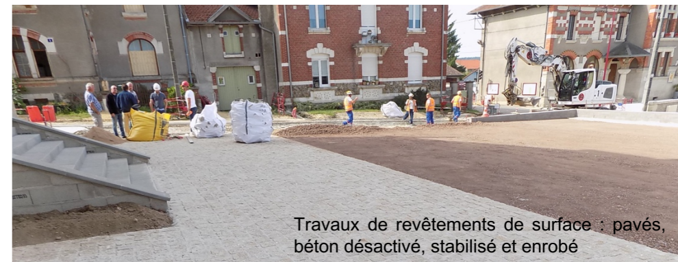
Travaux de revêtements de surface : pavés, béton désactivé, stabilisé et enrobé