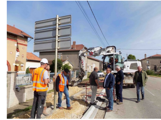
Travaux préparatoires : fin des réseaux secs et terrassements voirie (mars 2017)