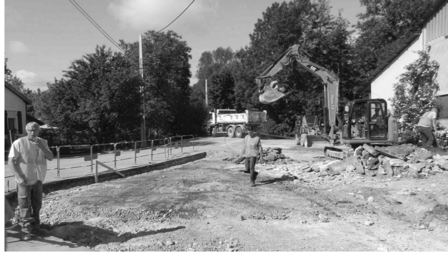
RD 20 – Intersection avec la Rue Montante