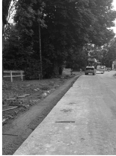
RD 20 - Entrée Sud Ouest (Rouet Ippécourt)