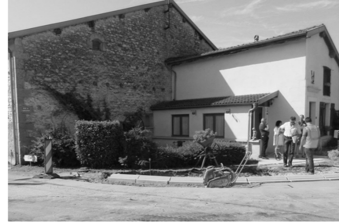
RD 20 – Pont et intersection Rue de la Fontaine