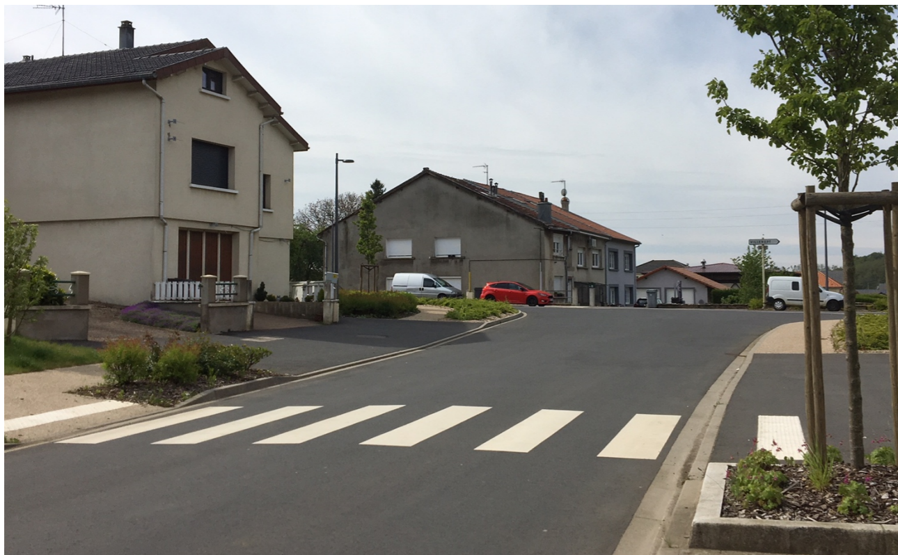
Reconfiguration du carrefour