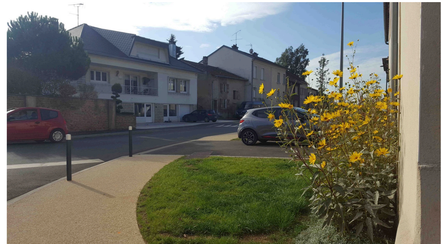
Continuité piétonne sécurisée