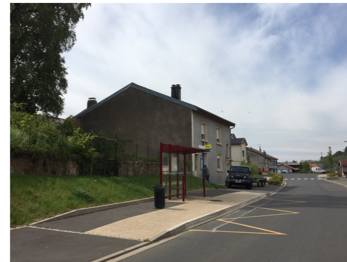
Arrêt de bus aux normes