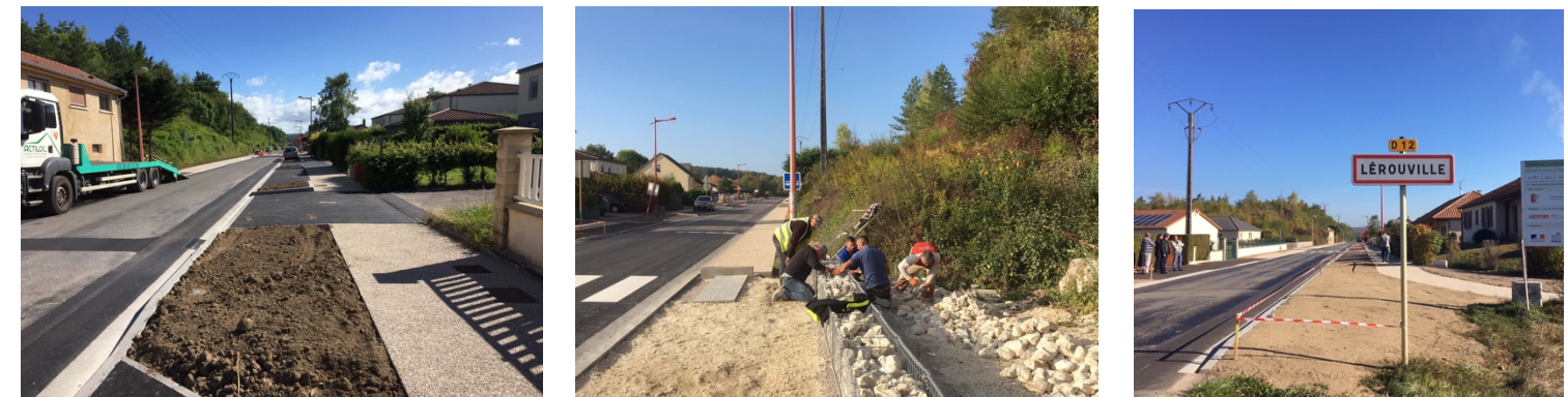
Travaux de terrassements, pose de bordures, béton désactivé, dalles evergreen et enrobé