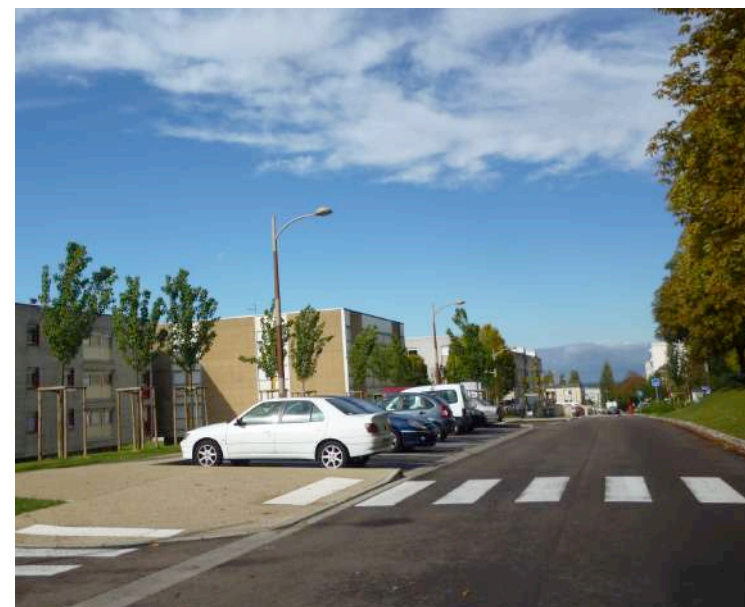
Aménagement du Boulevard avec stationnement