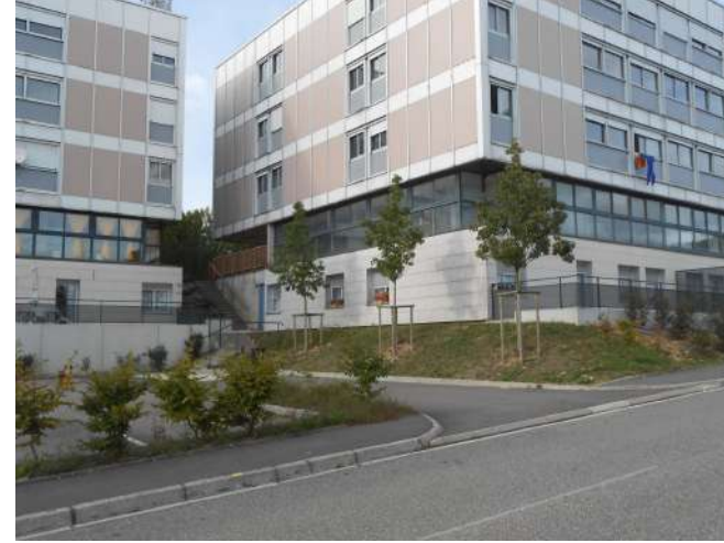
Terrasses privées pour les appartements du rdc