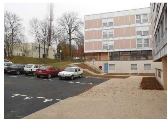
Large parvis devant les immeubles