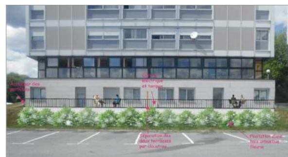
Photomontage - terrasse