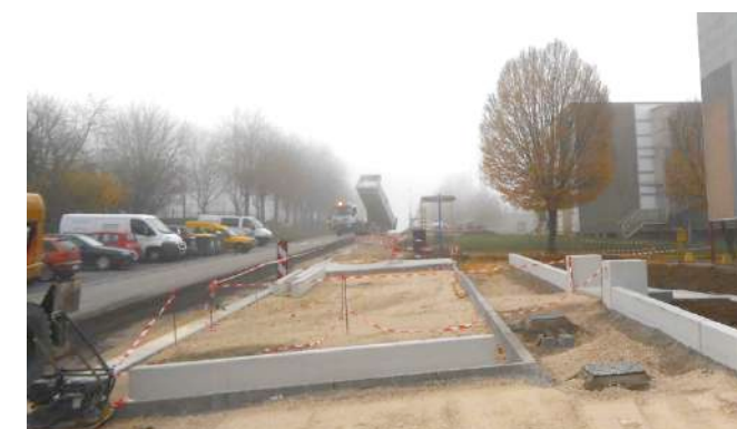
Mise en œuvre de murets préfabriqués en béton