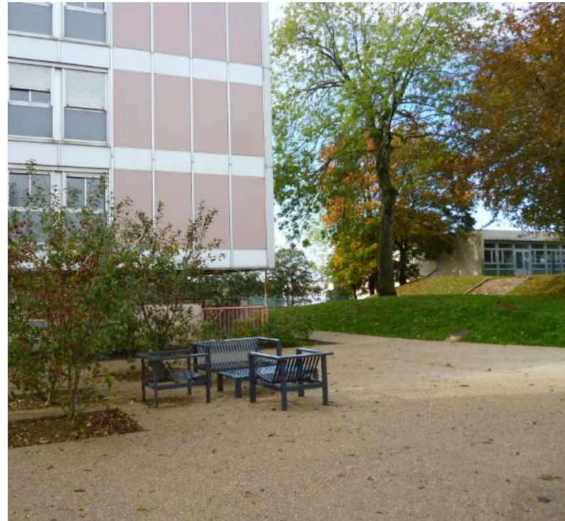
Espace public convivial en pied d'immeuble