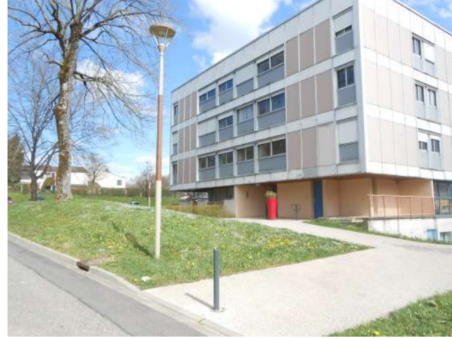
Requalification des accès aux immeubles