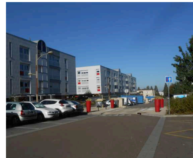
Chicane au niveau de l'accès collège