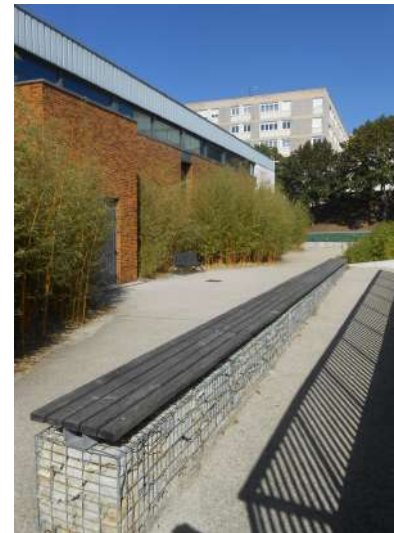
Rampe PMR en gabions et assise bois