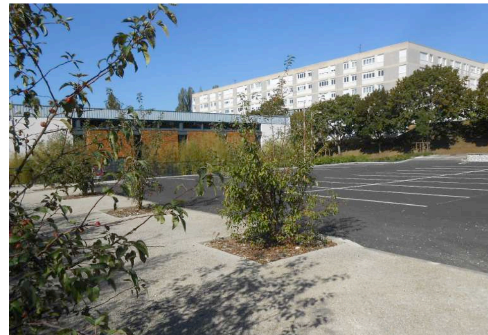
Parkings aux abords de la salle socio-culturelle et du centre commercial