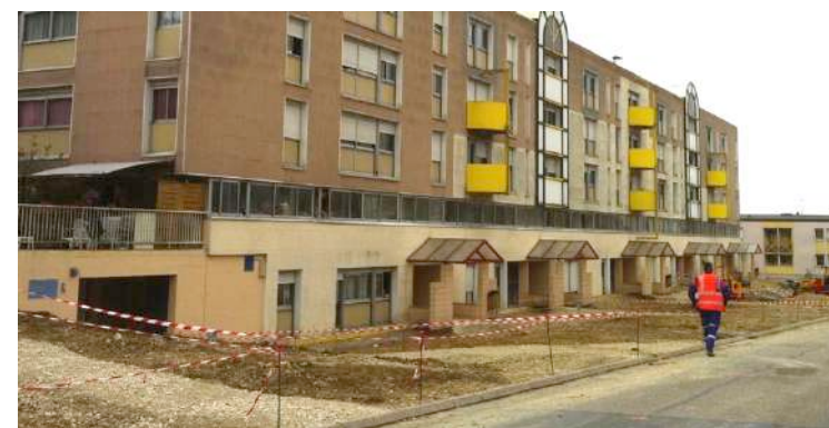
Terrassement des pieds d'immeubles