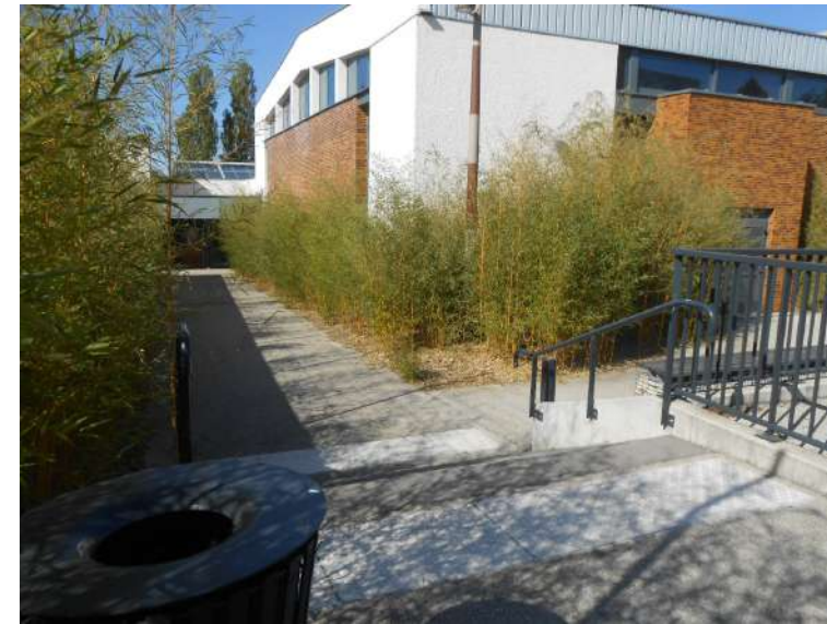
Abords de la salle socio-culturelle