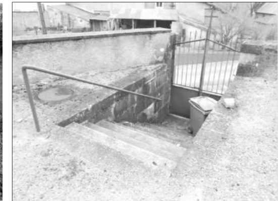
Accès existant par escaliers