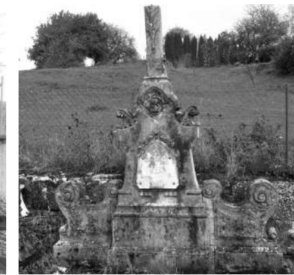
Pierres tombales abandonnées