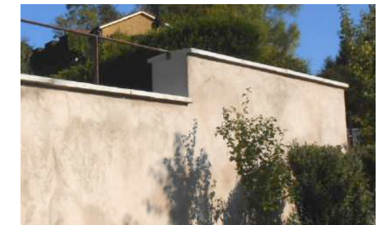
Reprise du mur d'enceinte