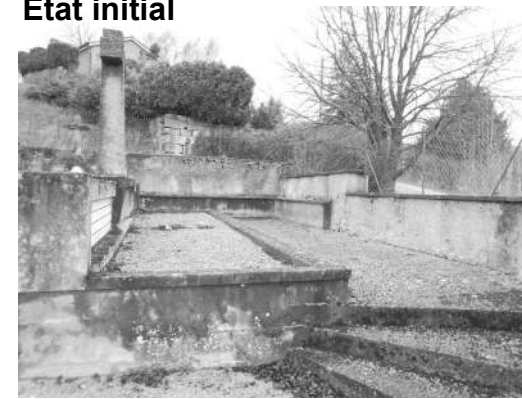
Cénotaphe vétuste en béton