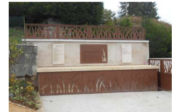
Création d'un nouveau cénotaphe