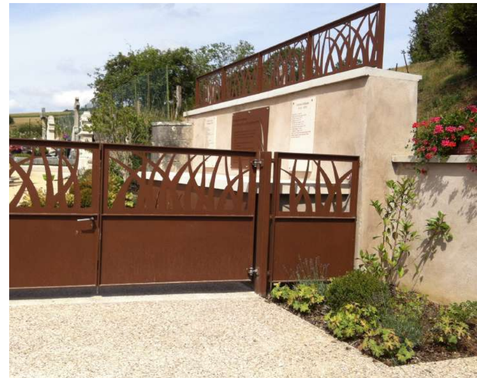
Création d'une nouvelle entrée accessible à tous