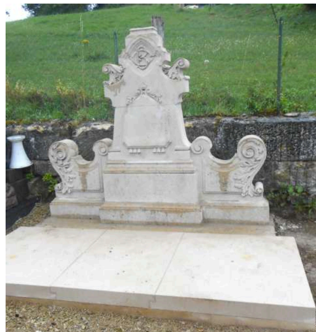
Rénovation/création d'un ossuaire communal