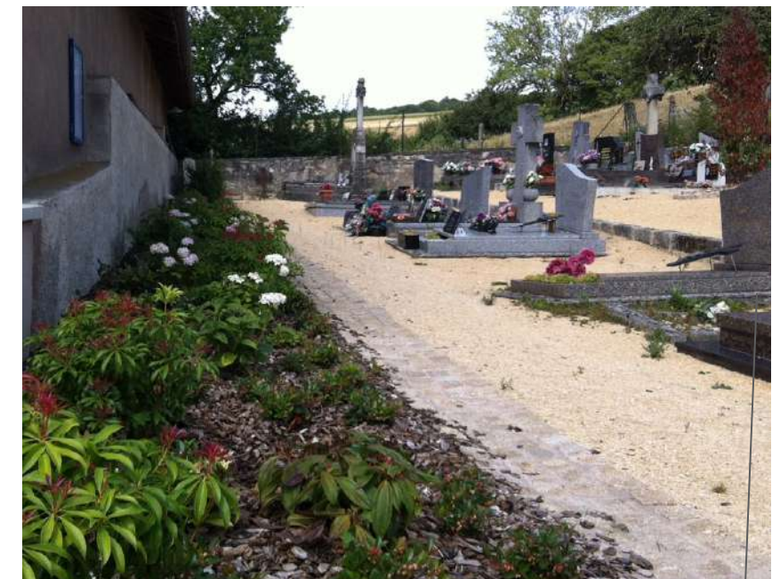
Réfection du cimetière : allées stabilisées, pavés, plantations...