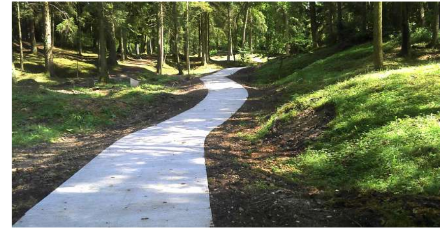
Chemin en béton balayé