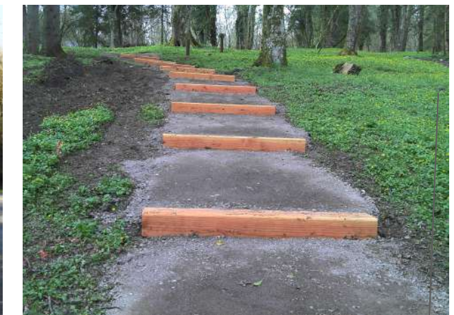
Pas d'ânes - nez de marche en bois