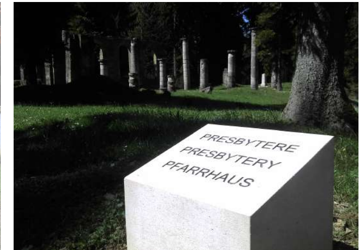
Borne gravée en pierre