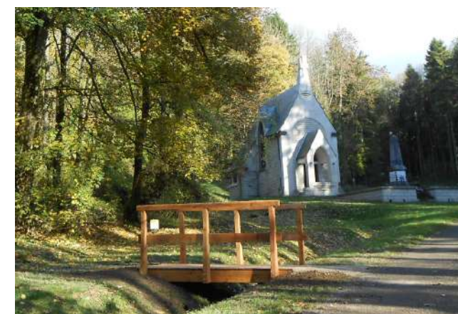
Passerelle en bois