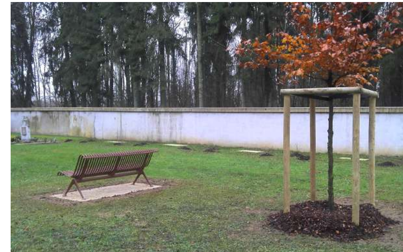
Plantation et mobilier