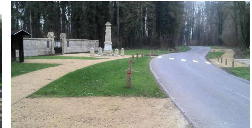
Cheminement et stationnement en concassé