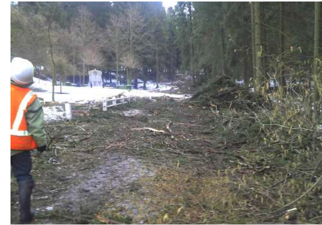
Abattage et dessouchage d'arbres

Les huit villages détruits concernés par l'aménagement sont : Beaumont-en-Verdunois, Bezonvaux, Cumières-Le-Mort-Homme, Douaumont, Fleury-devant-Douaumont, Haumont-Près-Samogneux, Louvemont-Côte-du-Poivre et Ornes