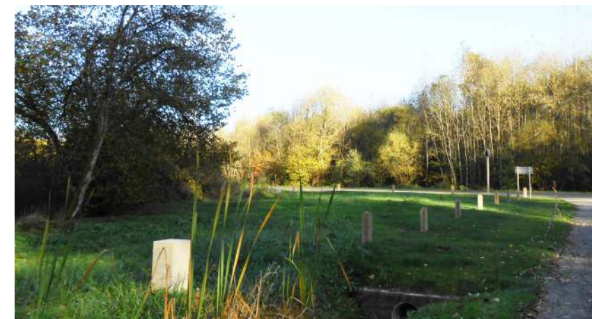
Pose de bornes marquant l'ancien front bâti